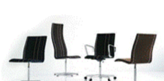
Stol Oxford model 3172 Obdelava: usnje, aluminij Oblikovanje: Arne Jacobsen Leto oblikovanja: 1965