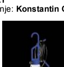
Barve: oranžna, modra, črna Proizvajalec: Flos