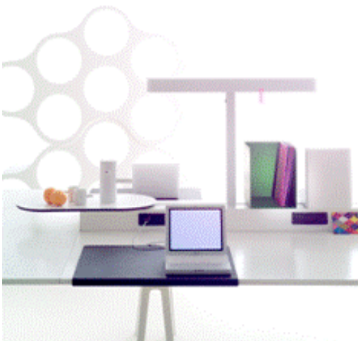
Oblikovanje: Ronan in Erwan Bouroullec.

Način dela v sodobno organiziranih podjetjih se je z uporabo novih tehnologij korenito spremenil. Delamo lahko kjerkoli in kadarkoli. Še do nedavnega uveljavljeno klasično delovno shemo enega zaposlenega na eno delovno mesto, od 9h do 17h nadomeščajo novi principi dela. Sodobno organizirano podjetje mora zaposlenim omogočiti primerno osnovo za identifikacijo v okviru celostne podobe podjetja, zagotoviti prostor za izmenjavo informacij, skupinsko delo, mrežno delo, družabna srečanja in nujno potreben občutek pripadnosti podjetju ter zagotoviti neomejen dostop do informacijskih mrež, sodelavcev, storitev in tehnologij.