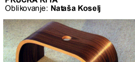
Obdelava: bukov ali orehov furnir Proizvajalec: Stol pisarniški stoli