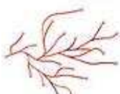
Algae, Design Ronan & Erwan Bouroullec, 2004