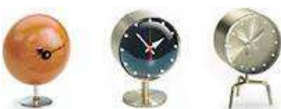
Desk Clocks, Design George Nelson, 1947-54