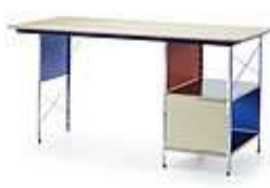
ESU Shelf, ESU Bookcase, EDU, Design Charles and Ray Eames, 1949