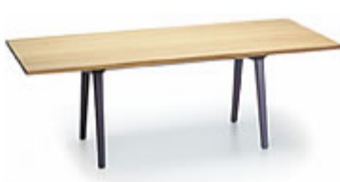
Soft SIM, Design Jasper Morrison, 2004